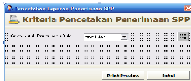
Gambar 8. Rancangan form input kriteria pencetakan penerimaan SPP